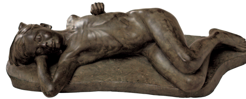
IL DORMIENTE (1909)

Ciusa, profondamente legato a Sebastiano Satta (1867-1914), concepisce in sua memoria un "Tempio ai Figli di Sardegna" da erigersi nella collina di S. Onofrio a Nuoro. Il progetto vedrà la luce solo nel 1932, ridotto e semplificato, ma dell'idea originale restano alcuni gessi, tra cui il bel ritratto del poeta, centro della composizione. La figura, meditativa e solenne, di gusto secessionista, è fusa con la sua base, ad indicare l'opposizione fra materia e spirito. Le mani, vigorose e grandi, simboleggiano una forza interiore indomabile, opposta alla debolezza fisica del poeta, malato e paralizzato sin dal 1908.